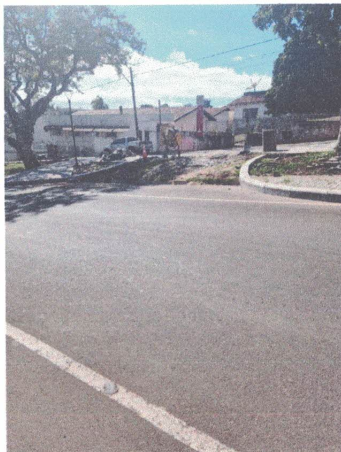
DAIA LUBRIFICAÇÕES Vereador