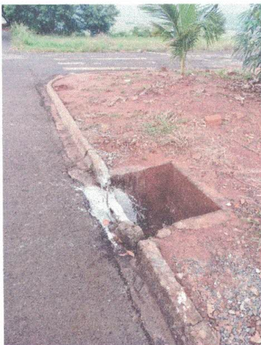
DAIA LUBRIFICAÇÕES Vereador

Plenário Maurício Fagundes de Souza, em 21 de maio de 2026